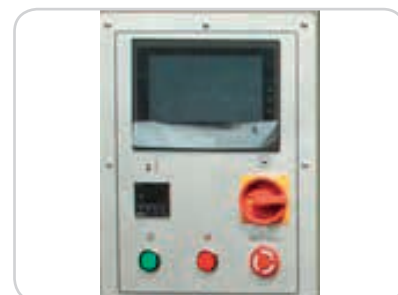
Abb.: Digitales Bedienfeld / Touchscreen