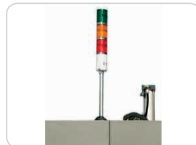
Abb.: Alarmsignalleuchte BP-6040D