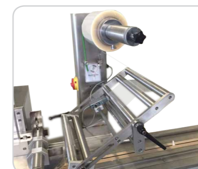
Folienaufnahme inkl. Folienformschulter