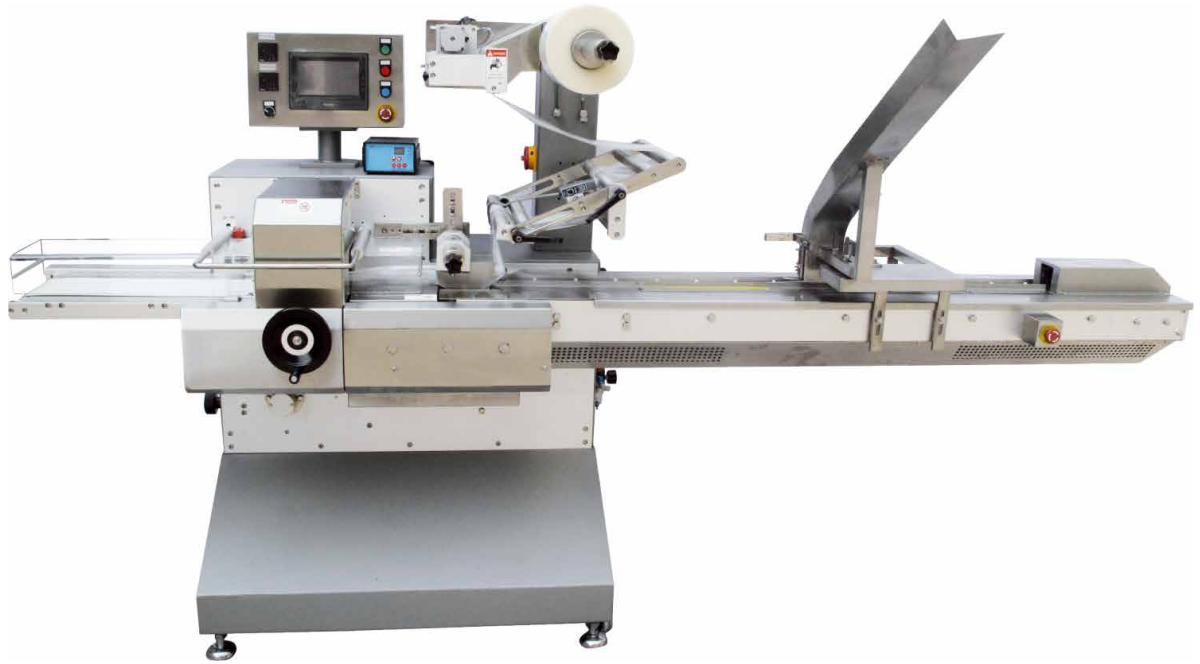
FWH-Serie inkl. Drucker und Produktmagazin