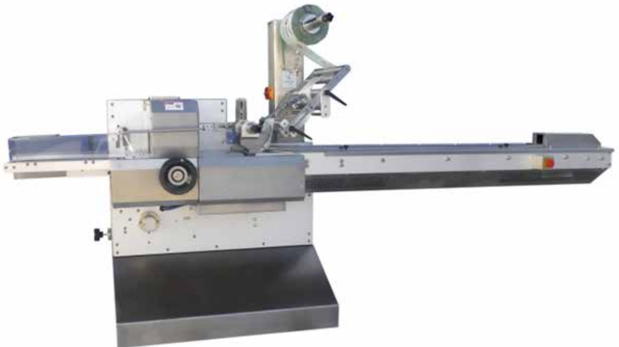
FWH-Serie für Eisverpackung mit integriertem Kühlsystem im Schweißmesser