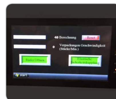
Touchpanel mit Farbsymbolen