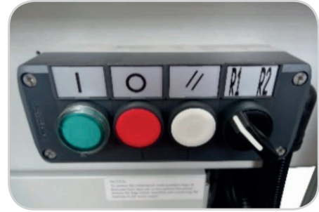
Abb.: KPM-105SDR / Bedienfeld