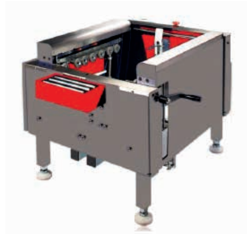
Abb.: KPM-116, halbautomatisch