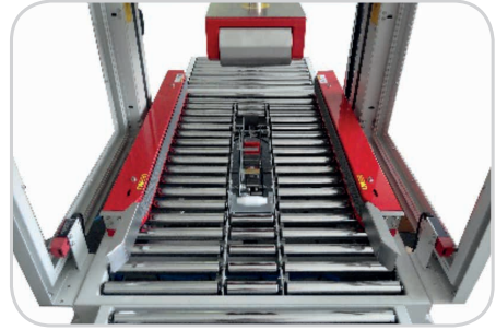
Abb.: KPM-105SDR autom. Kartonjustierung