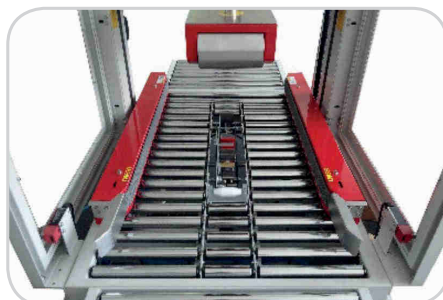
Abb.: KPM-105SDR autom. Kartonjustierung