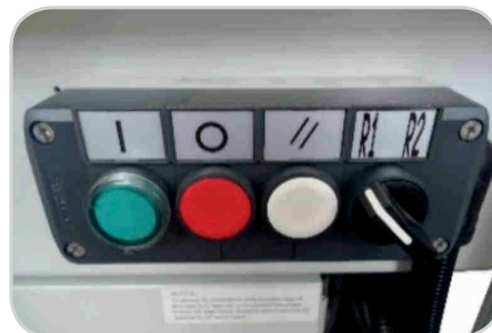
Abb.: KPM-105SDR / Bedienfeld